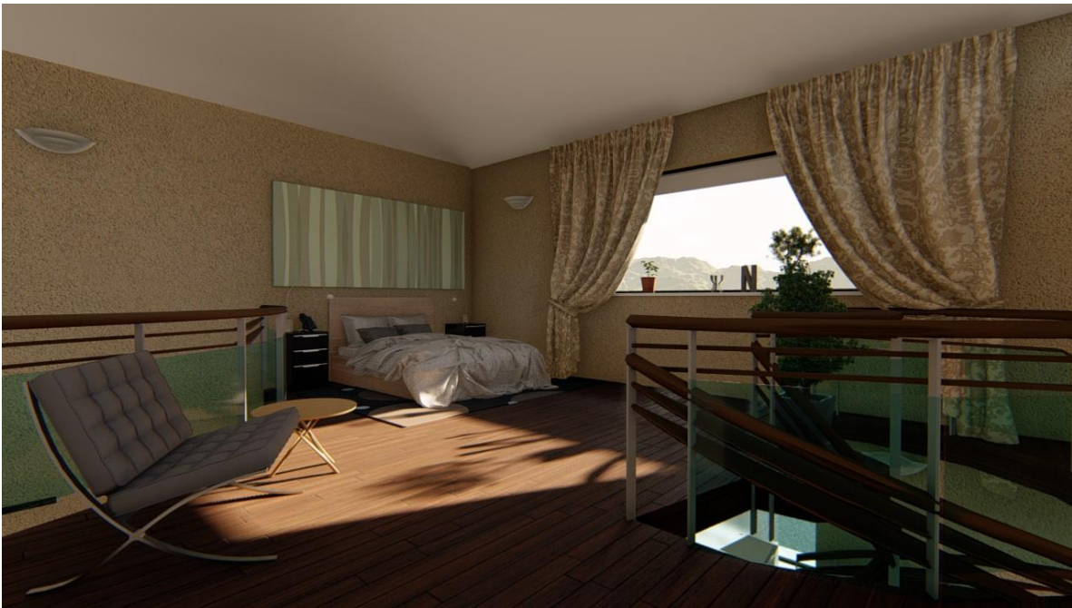
Render di alcuni progetti in fase di realizzazione